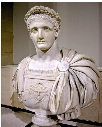
多米田（Titus Flavius Domitianus）

保罗和彼得都在残暴的尼禄皇帝统治下（54 - 68 A.D. 在位）殉道。到多米田（Titus Flavius Domitianus, 51 - 96 A.D.）作皇帝的时代，他自称是神，对他的膜拜主要集中在亚西亚地区，尤其其他统治的晚期，大约在公元 90 年代逼迫尤甚（参基纳，Graig S. Keener 的注释书《启示录》，汉语圣经协会，2009，页 32 - 33）。