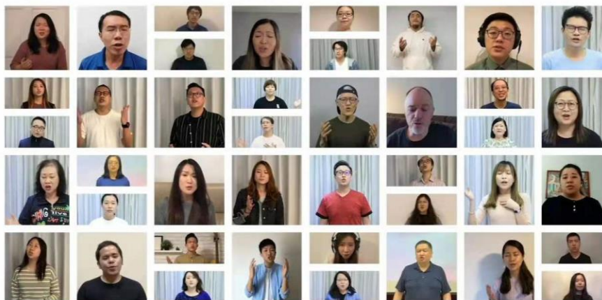
注目祿 Fix my eyes on You

我们在新的一年仍然要持续抗疫，让我们把焦点注目耶稣，不让愁苦、困惑与拦阻遮蔽我们。让我们全心注目耶稣，人生的每一步都交给主，让主重新引导我们成长。