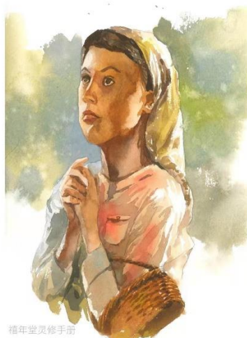
禧年堂灵修手册 愿意照你的话实现 将临期2020 | 路加福音一章与旧约影子

新加坡长老会禧年堂每年都会为将临期和大斋期编写中英文的灵修材料，内容非常丰富，很详细解释经文，帮助信徒在生活中应用。今年的将临期灵修材料《愿意照你的话实现》，融合了路加福音第 1 章中的圣诞故事以及其中所蕴含的旧约影子。