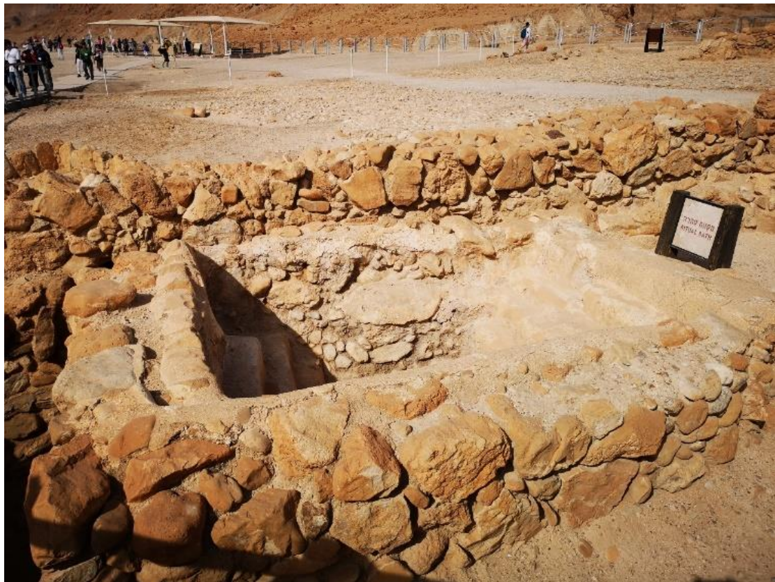
爱色尼人的洁净池